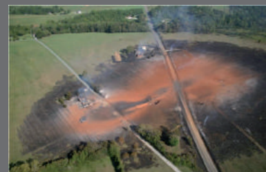
Conséquences d'une fuite sur une canalisation de transport, Appomattox (USA), 14 septembre 2008.