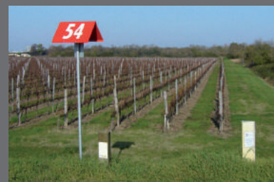
Différents types de bornes repérant les canalisations de transport