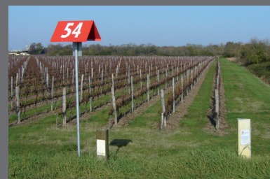
Différents types de bornes repérant les canalisations de transport