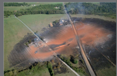
Conséquences d'une fuite sur une canalisation de transport, Appomatox (USA), 14 septembre 2008.